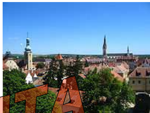
Kőszeg látképe a Jurisics-várból