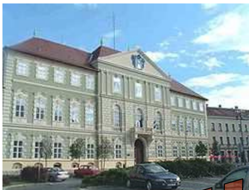
A szombathelyi megyeháza